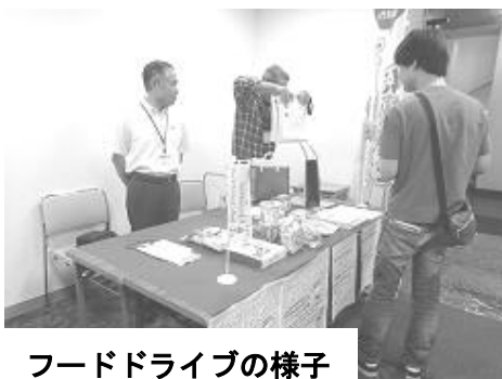
フードドライブの様子

9月2日、長岡で「ワーク&ライフフォーラム in 長岡」が開催されました。「仕事と生活のバランスをどう捉えていけばよいのか」のテーマの下、毎年フードバンクも参加しています。今回は食品ロスを中心に映画「Just Eat It」の上映と講演をさせていただきました。フードドライブも併せて開催しました。